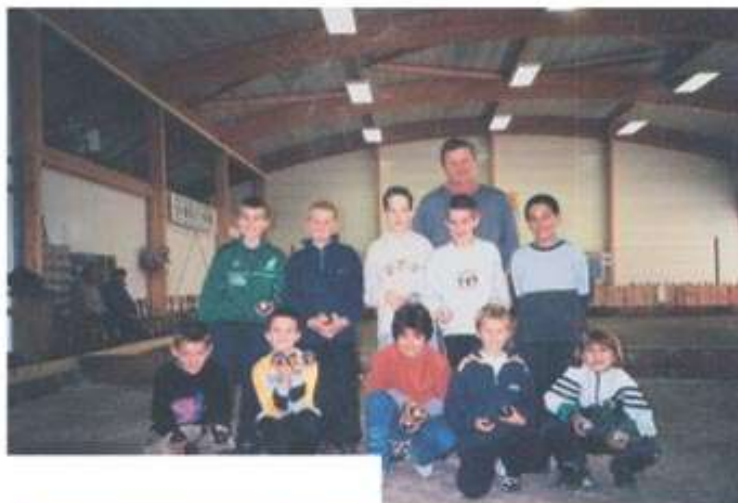
"Répit pour le cochonnet, le temps d'une pose photo pour les jeunes minimes et cadets de l'école de pétanque."